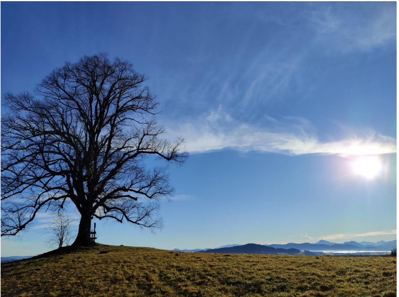
„Linde am Thurn“ – geschütztes Naturdenkmal seit 1992